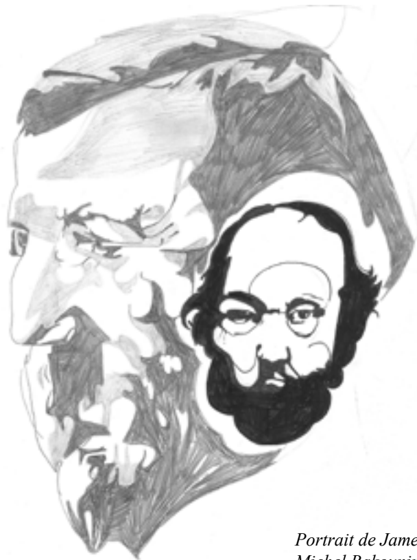
Portrait de James Guillaume et Michel Bakounine par Ralouf